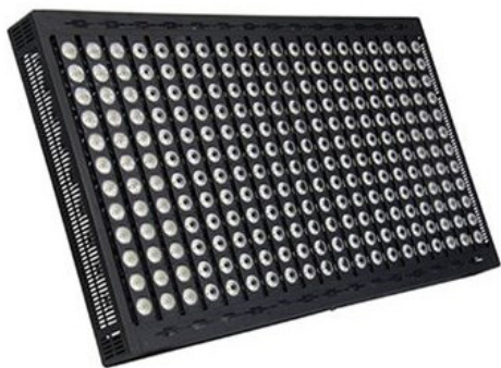
NorthLED Ligalight 3000 A3

LED Ligalight armaturerne er armaturer udviklet til udendørs belysning af større arealer og områder. Teknologien er patenteret og udviklet i et samarbejde mellem NorthLED ApS og Danmarks Tekniske Universitet, Afdeling for Fotonik.